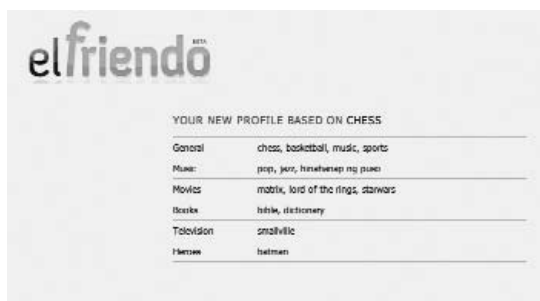
Figuur 1: Een door Elfriendo.com gesuggereerd MySpace-profiel, gebaseerd op de hobby ‘schaken’.

MySpace-gebruikers met de hobby schaken noemen op hun profielpagina's The Matrix , Lord of the Rings , Star Wars , de Bijbel en het woordenboek als favorieten.