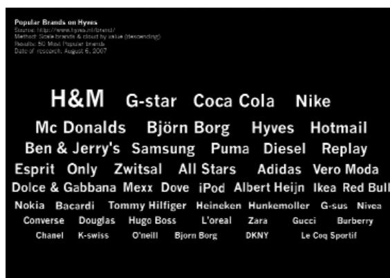
Figuur 4: De 50 meest populaire merken op Hyves. Een voorbeeld van post-demografische analyse van de Nederlandse sociale netwerksite.

Deze 'brand cloud' (merkenwolk) toont de populairste merken onder Hyves-gebruikers. Deze 50 merken worden het meest genoemd in profielen van 'Hyvers'.